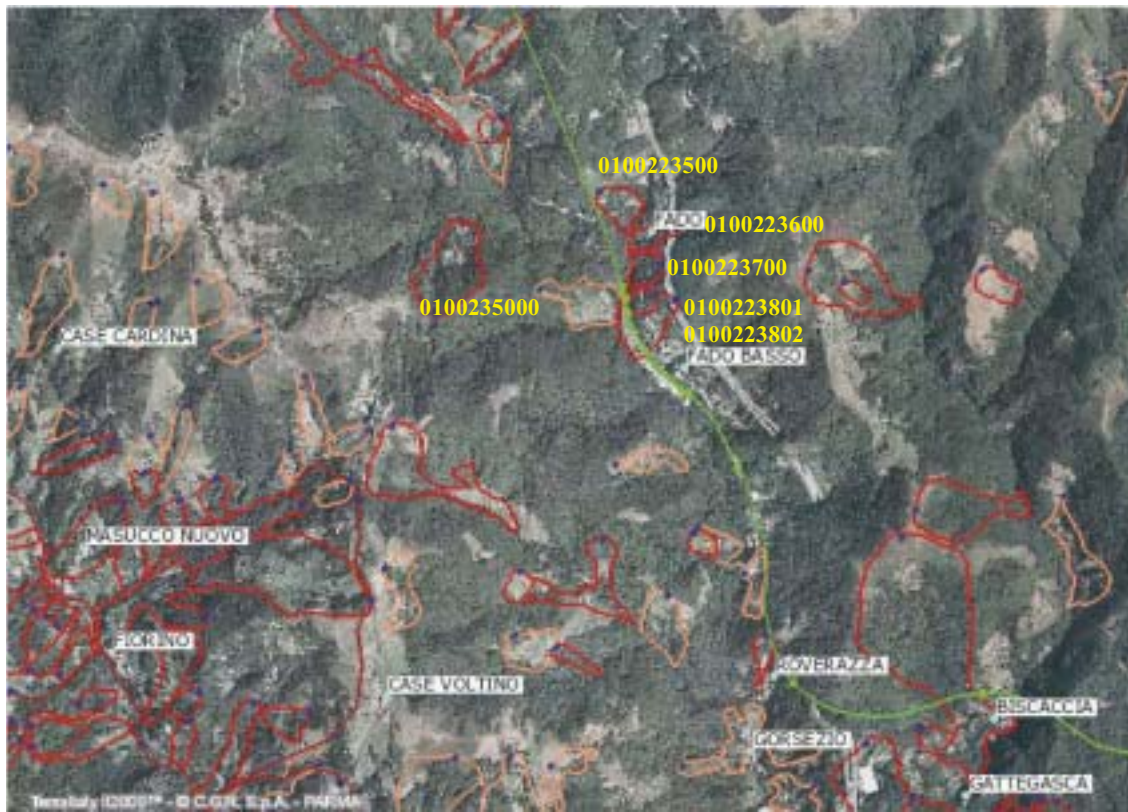
Figura 4.1.53: Fotogramma su Fado