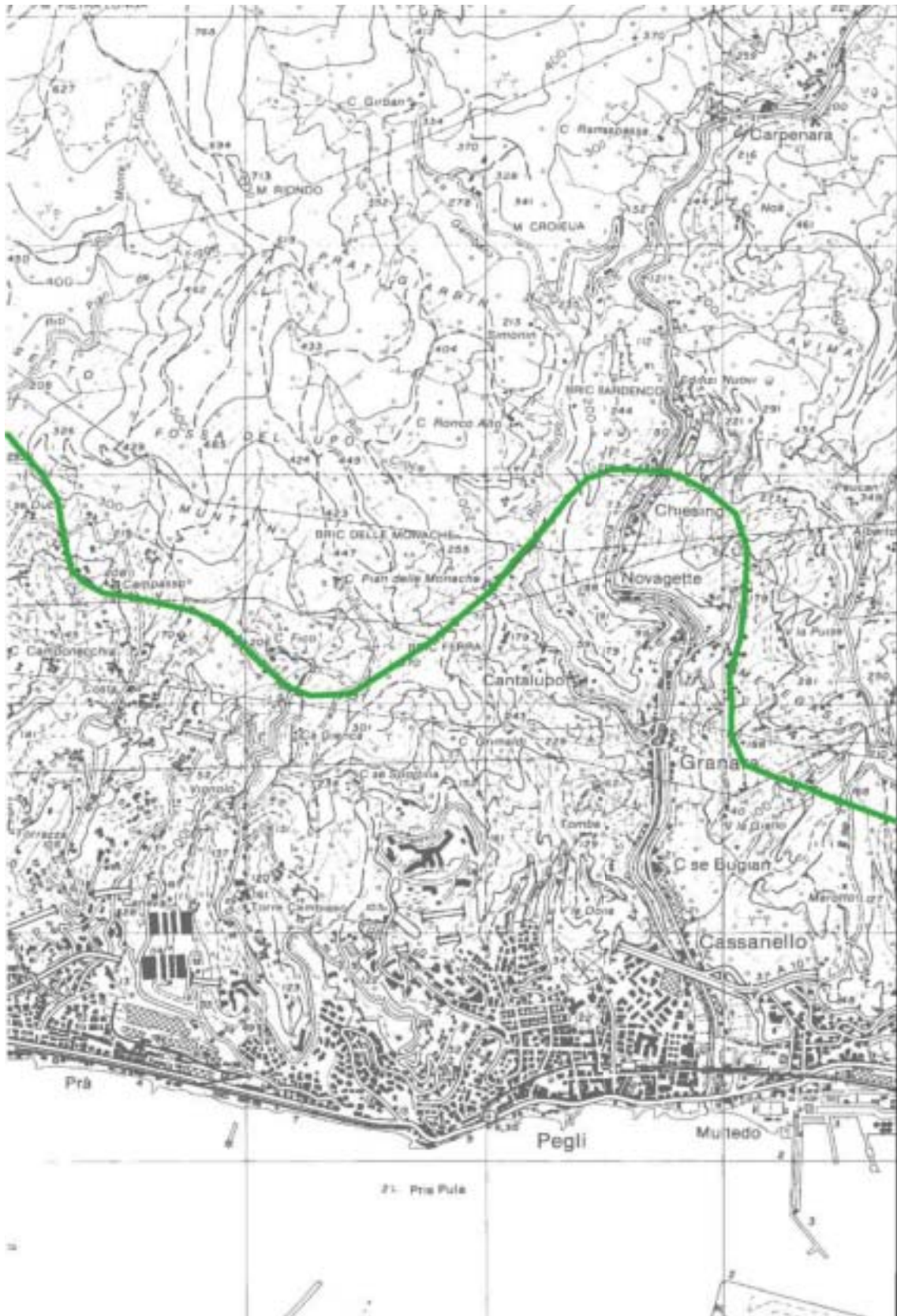
Figura 4.1.49: Cartografia zona di Cantalupo