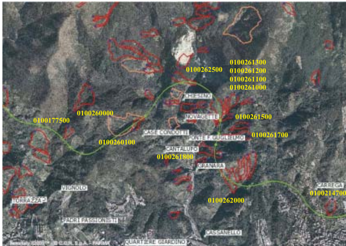
Figura 4.1.48: Fotogramma su Cantalupo