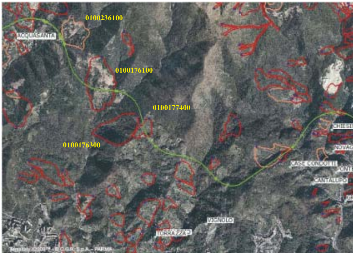
Figura 4.1.50: Fotogramma su Vignolo