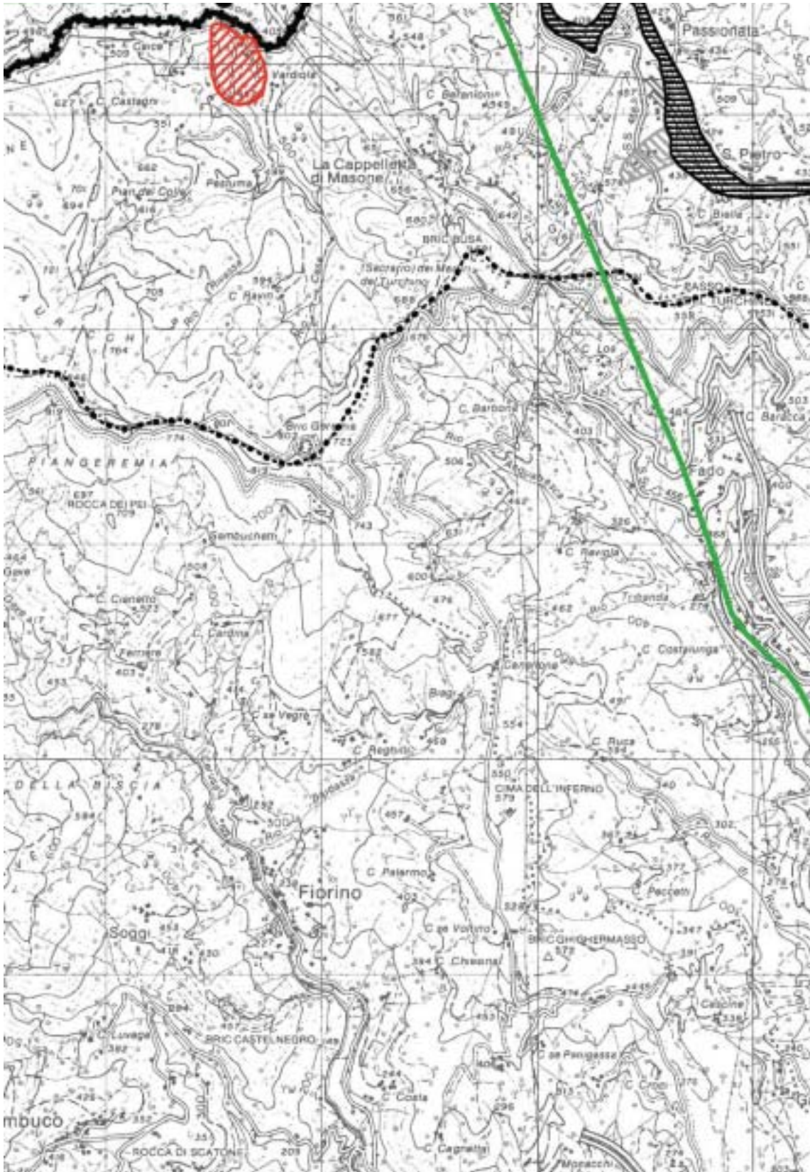
Figura 4.1.56: Cartografia zona di Masone