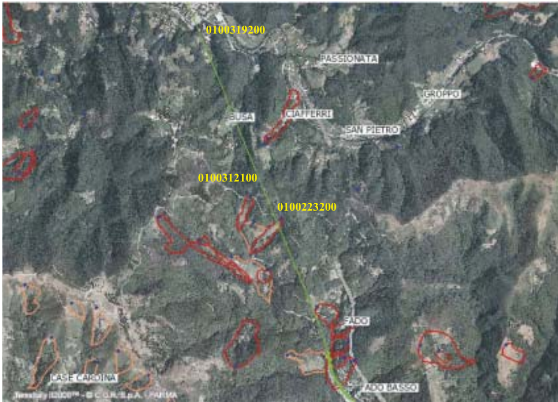
Figura 4.1.54: Fotogramma su Bussa