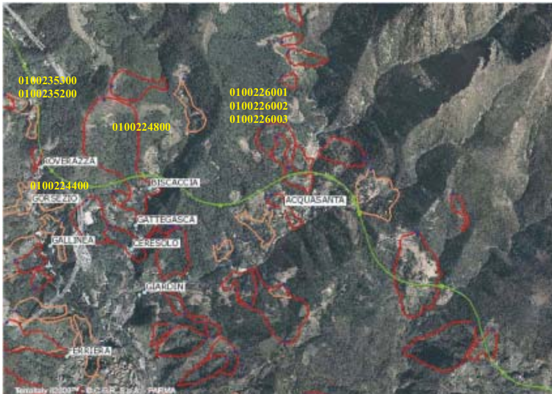
Figura 4.1.51: Fotogramma su Acquisanta