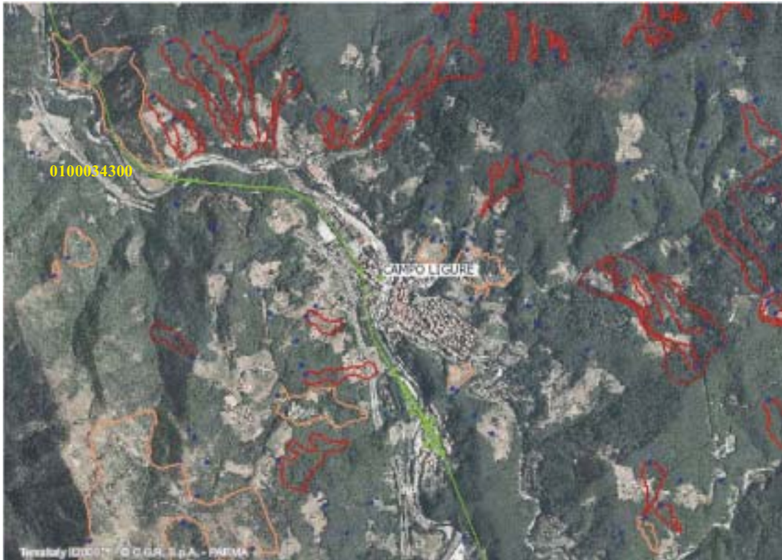
Figura 4.1.57: Fotogramma su Campoligure

IDFRANA 0100034300 COD_FRANA 010051076 TIPO area soggetta a crolli diffusi STATO non determinato AUT BAC Autorità di Bacino del Fiume Po