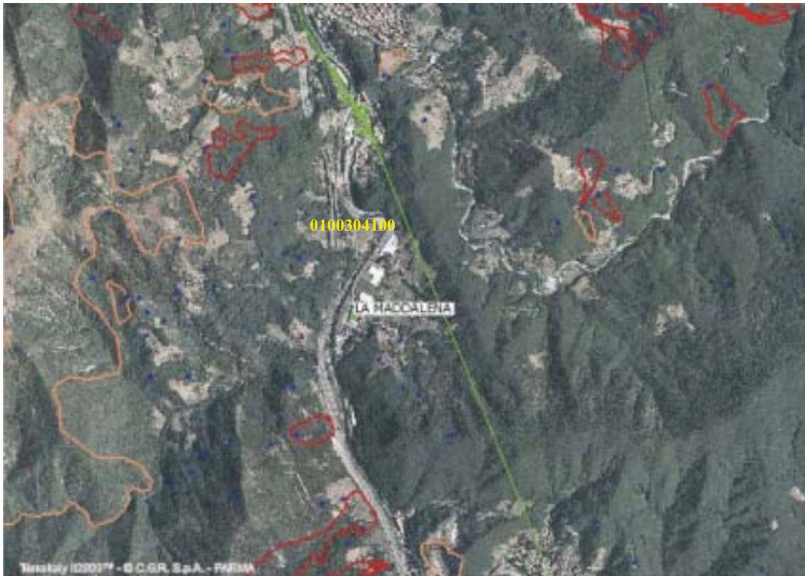
Figura 4.1.55: Fotogramma su La Maddalena

IDFRANA 0100304100 COD_FRANA 010008091 TIPO frana complessa STATO quiescente AUT BAC Autorità di Bacino del Fiume Po