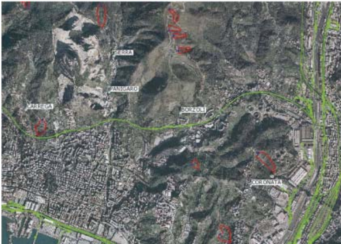
Figura 4.1.47: Fotogramma su Borzoli